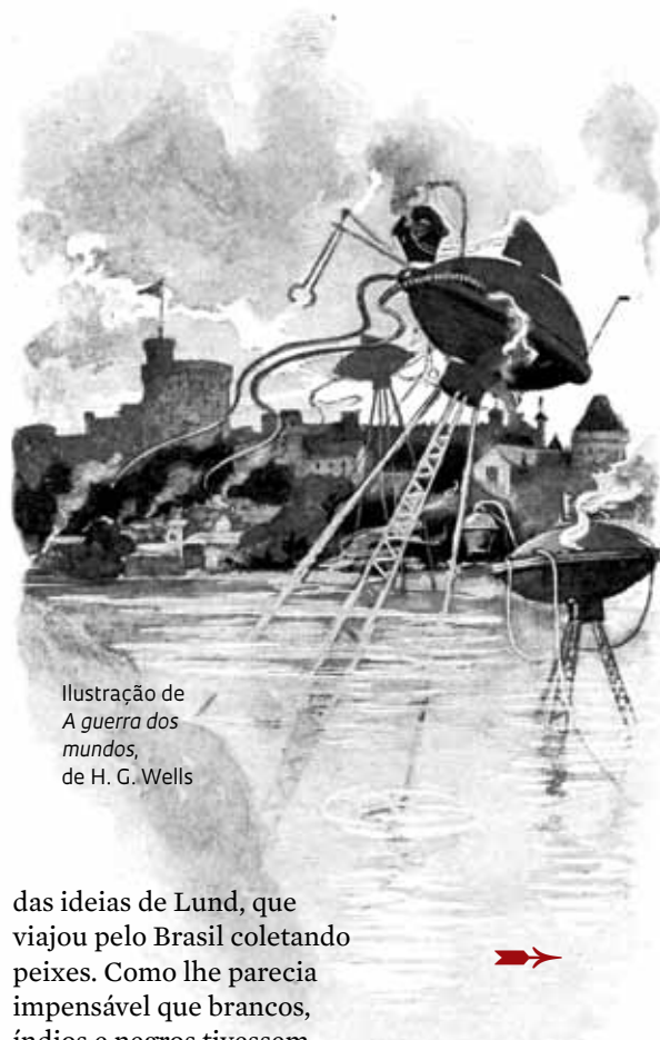
Ilustração de A guerra dos mundos , de H. G. Wells

Apareceu diante dele uma figura luminosa, semelhante ao que se pode idear de mais perfeito na forma humana, massa cósmica, espécie de chama cor de ouro, que se agitava às mais ligeiras ondulações do ar, sem perder nunca a pureza dos contornos. — Dr. Benignus, disse-lhe a maravilhosa aparição, eu sou o habitante que tu procuravas inutilmente nas regiões do espaço.