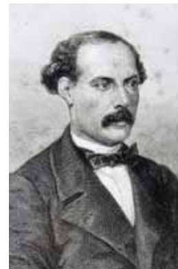
Júlio Verne e Augusto Zaluar (à dir.), seu discípulo português radicado no Rio de Janeiro

que analisou O doutor Benignus em 2014 como pesquisador da Universidade Federal de Ouro Preto (Ufop). Segundo ele, o livro participou do processo de expansão e institucionalização da ciência no Brasil – o Jardim Botânico havia sido inaugurado em 1808, a Academia Real Militar em 1810 e o Museu Nacional em 1818 – e da delimitação de áreas de especialização pelos cientistas profissionais.