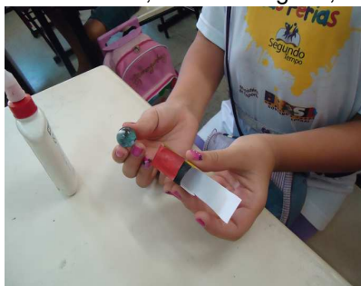
Figura 1: Máquina Simples – Robô Lagarta.

1ª Oficina: Robô Replicante – Construção de uma máquina simples que imita os movimentos de uma lagarta. Material: molde; bolinha de gude; tesoura; e cola.