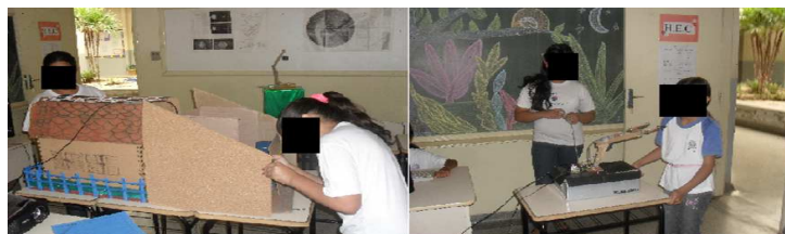
Figura 3: “Garagem” e “Braço” controlados por servomotores .

7ª Oficina: criação de robôs operados por computador, seguindo as especificações técnicas propostas no livro “Visual Class FX: Multimídia – Software para Criação”. O programa Visual Class®, então disponível na escola, permitiu controlar os servomotores através de “Objetos Botão Animado” e os sensores via “Rótulo”.