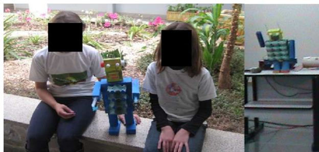
Figura 4: Robô Humanoide controlado por servomotores .